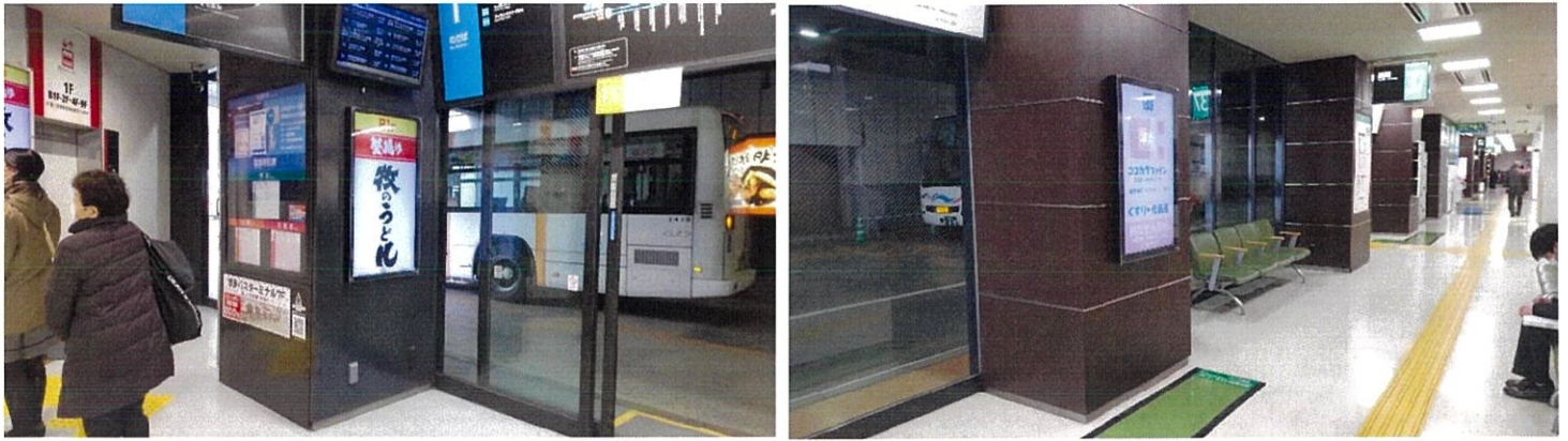
天神・福岡タワー方面のりば